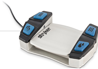
Interruptor de pé NSE com quatro botões personalizáveis (dois à esquerda, dois à direita)

Pode escolher entre dois interruptores de pé, cada um com 2 a 4 botões para definir as funções desejadas, como ligar/desligar irrigação, sentido frente/reverso, mudança de atribuição de porta para broca, mudança de RPM, entre outras.