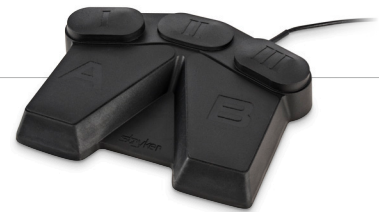
Interruptor de pé bidirecional Pedal duplo com três botões personalizáveis