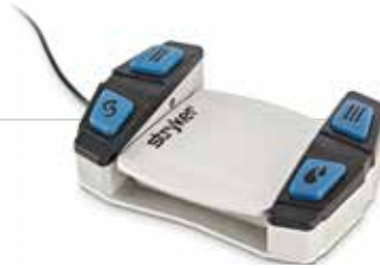
Pedal NSE con cuatro botones personalizables (dos izquierda, dos derecha)

Dispone de dos pedales, cada uno de ellos con entre dos y cuatro botones, para configurar las funciones deseadas, como activación/desactivación de la irrigación, dirección hacia delante/hacia detrás, asignación de cambio del puerto del motor, cambio de RPM y mucho más.