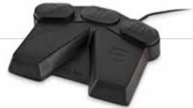
Pedal bidireccional Pedal bidireccional y dual, con tres botones personalizables