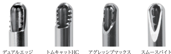
デュアルエッジ トムキャットHC アグレッシブマックス スムースバイト