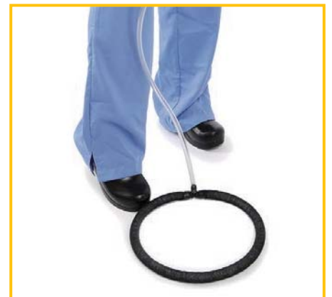
機動性のサクシオンリング