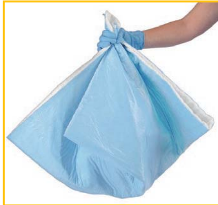
裏移りないバックビニル付