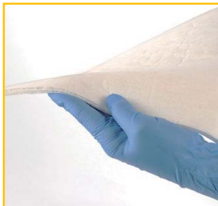
エコロジカルなクイックウィック