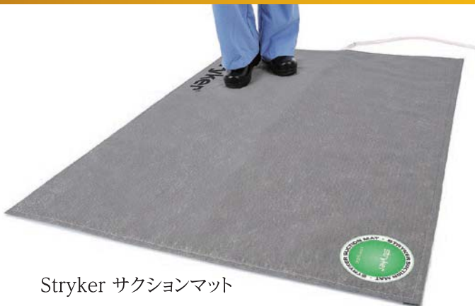
Stryker サクションマット