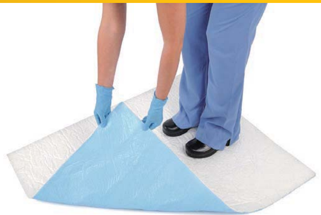
Stryker クイックウィック™

Stryker 床廃液マネジメント製品は、関節鏡・膀胱鏡・大腸鏡・心臓外科などの廃液の多い手技を安全に遂行するため、効率の良い廃液管理のお手伝いをいたします。