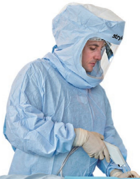
パーソナル・プロテクション・ システム