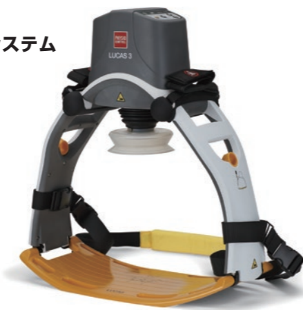
自動心臓マッサージシステム

1930年代、医療器具が患者の立場に たったものでないことを実感してい た一人の医師がいました。それが米 国ミシガン州カラマズー出身の整形 外科医、ホーマー・ストライカー博士 です。ストライカー博士は、昼間は 自ら患者の治療にあたり、夜は独自 の医療器具の開発に取り組みました。 背部手術の直後に思うように動けな い患者さんが楽に体の向きを変えら れるよう、回転するベッド「Wedge Turning Frame」を1938年に考案。 その後、自ら開発した医療器具を製 造する会社を設立し、それがストライ カーの始まりです。