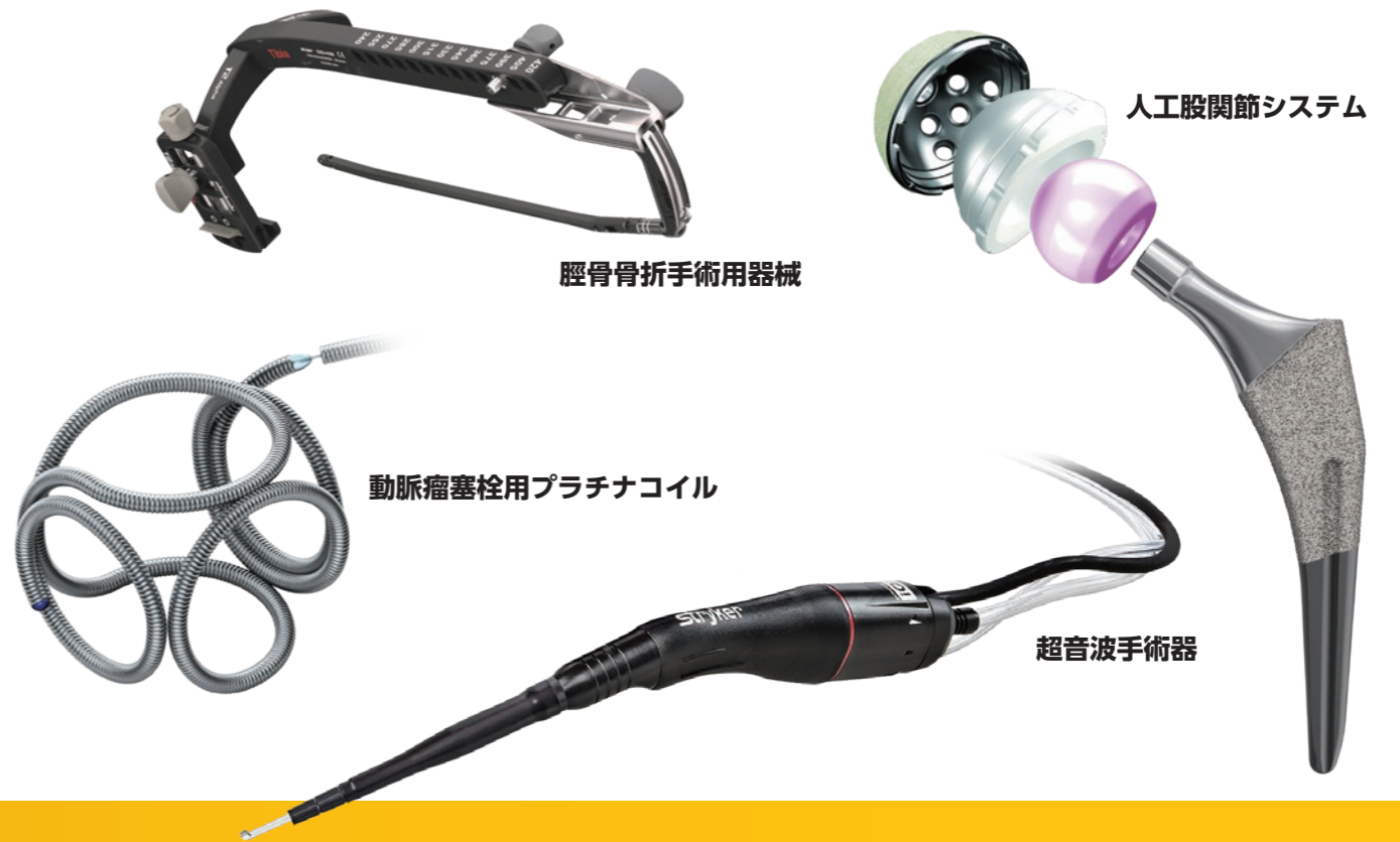
脛骨骨折手術用器械