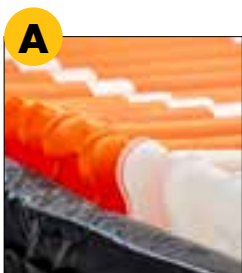
20 cm d'épaisseur d'air.