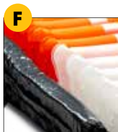
Support en mousse