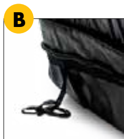
Sangle en D