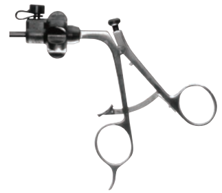
ラチェット付ハンドル非絶縁型 33cm SR-250-80-234*2