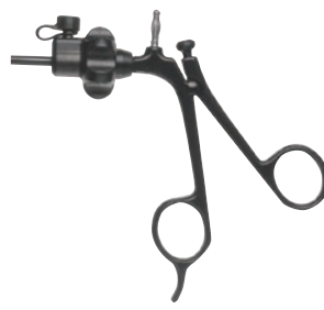
モノポーラハンドル 33cm SR-250-80-233*1