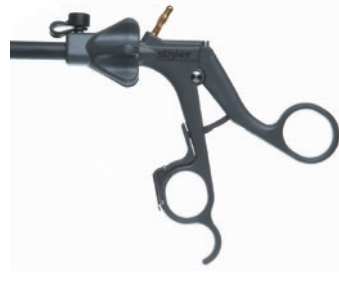
ピークマルチファンクションハンドル 33cm 0250-181-106*1