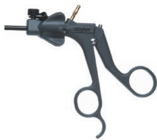
ピークモノポーラハンドル 33cm 0250-080-617*1