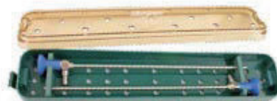
0233-032-108 滅菌ケース ラパロスコープ 2本用 L45 X W9 X H5 cm