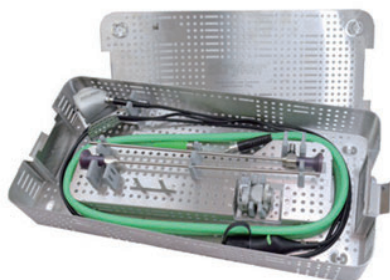
0233032302 滅菌ケース エンドスコープ・カメラ用 L52 X W25 X H7 cm