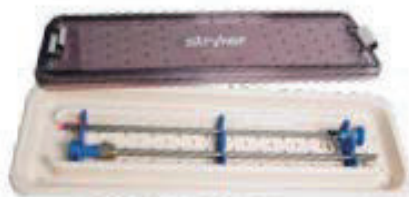
0233-032-111 滅菌ケース ロングラパロスコープ 2本用 L71XW24XH10 cm