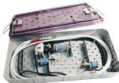
0233-032-105 滅菌ケース アーロスコープ・カメラ用 L52 X W24 X H10 cm