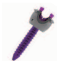
デフォーミティユニプレーナー