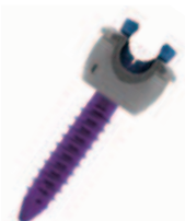
ファンデーション

スクリュー径(mm):4.5, 5.5, 6.5, 7.5, 8.5 スクリュー長(mm):25, 30, 35, 40, 45, 50, 55, 60